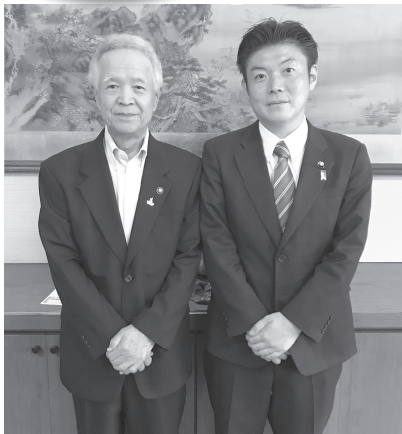
9月29日 市役所 石見利勝市長